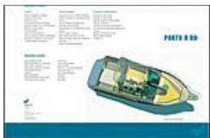
EQUIPAMIENTO ESTANDAR Y OPCIONAL