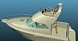
PORTU 8 80 FLY